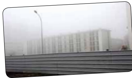
DÉMOLITION(S) de Marie de Busscher Court-métrage documentaire