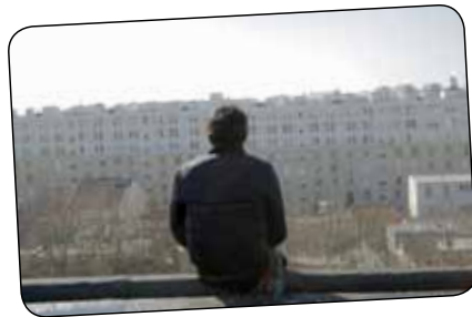
4 FROMAGES de David Chausse Court-métrage fiction