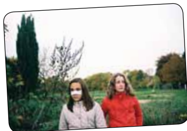
LOUVES de Constance Guirlet Court-métrage fiction