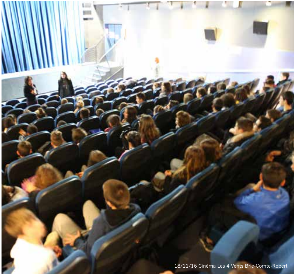
18/11/16 Cinéma Les 4 Vents Brie-Comte-Robert